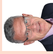
Pirmin Schwander, Consigliere Nazionale, Lachen SZ

«Il certificato Covid è contrario allo Stato di diritto e della società libera: senza nessuna evidenza delle persone vengono sospettate di danneggiare altre persone. Da questo sospetto devono scagionarsi con un certificato!»