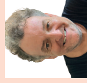
Marco Rima, cabarettista, ZG

«Il Coronavirus è reale, non c'è discussione. Però il fatto che il nostro Stato metta sotto pressione la popolazione con bugie e invenzioni mi lascia perplessa. I parallelismi con gli anni 30 del secolo scorso non hanno senso.»